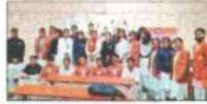
पंचमूर्ति विधि में अध्यक्ष और छात्र-छात्राएं