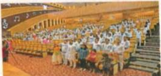
पर्यवेक्षण विधि विद्यार्थियों का जागरण में वाकन युक्ति का संकल्प लेते छात्र-छात्रा व अन्य = छात्रा संकल्प

राष्ट्रीय तंबाकू निषेध दिवस का आयोजन एक विशेष नरे 'जलसरोवर' की तंबाकू मुक्त बनने के लिए 'संघ-संघ' कार्यक्रम' का आयोजन किया गया। पर्यवेक्षण के छात्र-छात्राओं ने तंबाकू का सेवन न करने और अन्य को भी इसके लिए प्रेरित करने की शपथ ली।