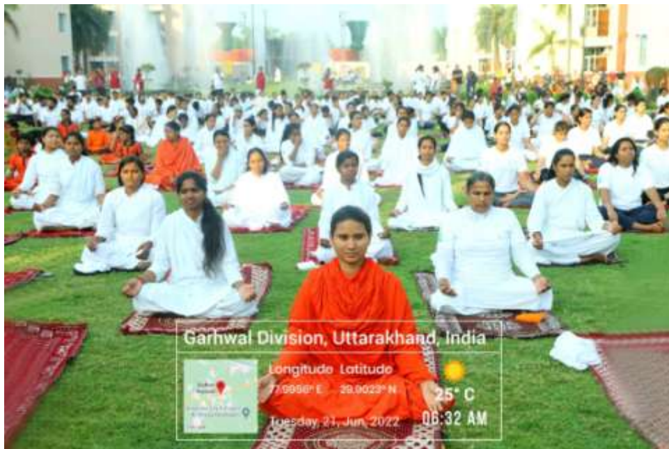
INTERNATIONAL YOGA DAY CELEBRATION AT HARIDWAR WITH PUJYA SWAMI RAMDEVJI MAHARJ